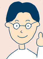
発達+軽度知的障がい

質問するのは悪いことではなく、仕事を正確に行うために大事なコミュニケーションであることを知った。わからないことはすぐ聞いて、返事も徹底するようになった。質問することへの恐怖心が減り、仕事のミスも減った。