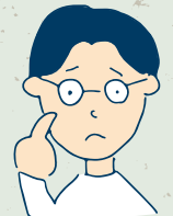
発達+軽度知的障がい

仕事の説明や道具の置き場所を一度で理解することができず、「何回同じことを聞く!？」とよく怒られた。怒られるのがイヤで、わからないことを聞かないでいるとミスが増え、さらに怒られてしまうという悪循環だった。